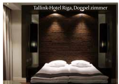
Tallink-Hotel Riga, Doppelzimmer