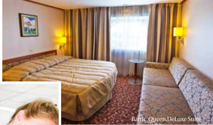
Baltic Queen, DeLuxe Suite