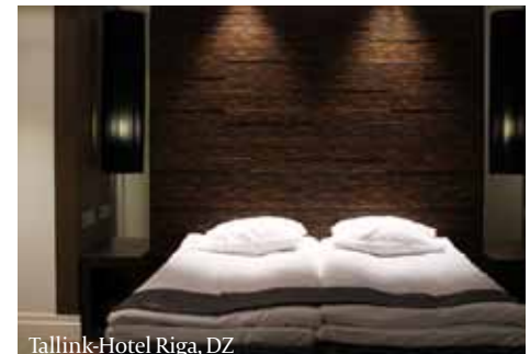
Tallink-Hotel Riga, DZ