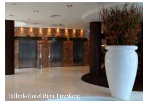
Tallink-Hotel Riga, Empfang