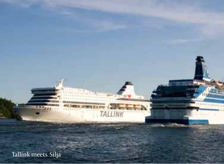
Tallink meets Silja