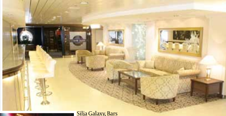
Silja Galaxy, Bars