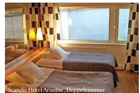
Scandic Hotel Ariadne, Doppelzimmer