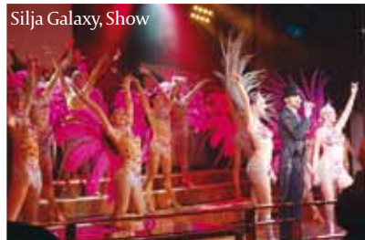
Silja Galaxy, Show